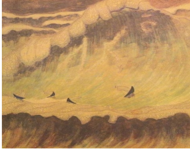
الشكل رقم(10): لوحة "سوناتا البحر Finale"