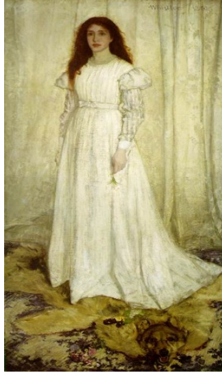
الشكل رقم (7) لوحة بعنوان: "بورترية الايرلندية جو" للرسام جيمس ويستلير (1834-1903) موجودة في The National Gallery of Art, Washington

لقد كان لون الرقعة غير متوقع بالنسبة لذلك الوقت. فالصورة ذات اللون الأبيض مرسومة على رقعة من نفس اللون. وكان هذا الأمر بحد ذاته يعتبر أحد الاكتشافات التشكيلية الصعبة. فقد عمل الفنان على هذا البورترية لفترة طويلة، حتى أنه تسمم بأكسيد الزنك. ولكنه استطاع حل مشكلة اللون ببراعة فائقة. ومع ذلك، فإن بعض زوار المعرض الذي أقيم في عام 1862 وعرضت فيه اللوحة اعتبروها غير مكتملة، وطعنوا في معايير قبولها. أما البعض الآخر فكان إيجابيا في تقييم هذه اللوحة، إذ وضع ناقد صحيفة "التايمز" الفنان الحاصل على المرتبة الأولى، واصفا إياه بأنه أبرز ما في معرض باريس، وكان أول من عرف اللوحة بـ"السيمفونية"، وذلك في إشارة إلى قصيدة تيوفيل غوتيه Théophile (1872-1811 Théophile Gautier المثيرة للجدل "سمفونية في مقام الماجور الأبيض" Symphony in White Major. وهذا ما أعجب الفنان، ليسمي منذ ذلك الحين الكثير من أعماله بمصطلحات موسيقية، مثل سمفونية، توزيع، هارموني، والليليات، ومصطلحات موسيقية أخرى. وبالطبع، لم يكن هذا الأمر نقلا ميكانيكيا لطرق مهارات الموسيقى، وإلا فإنه سيكون هناك انتهاك لقوانين كل فن على حساب الفن الآخر، والذي من شأنه أن يؤدي إلى ما يعرف بالتوضيح الخارجي، فنحن نتحدث عما تستفزه ألوان الرسام لدى المشاهد من مشاعر متقاربة مع ما تستفزه المؤلفات الموسيقية.