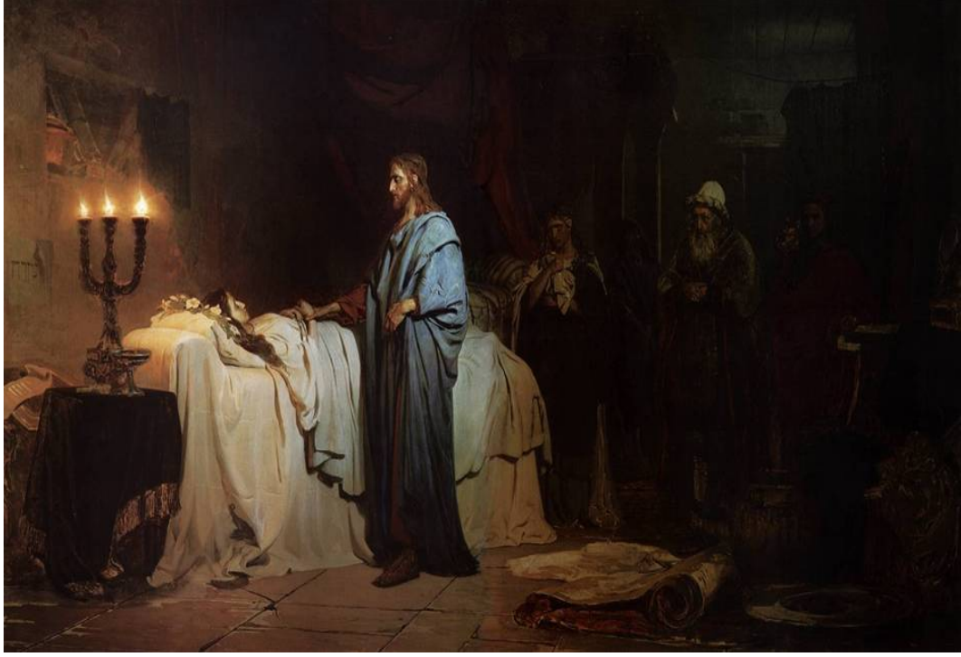
الشكل رقم (4) لوحة بعنوان: "The Raising of Jairus' daughter" للرسام ايليا ريبين (1844-1930) موجوده في The Hermitage Museum, St. Petersburg

وقد أحب الرسام الرومانسي الفرنسي يوجين ديلا كروا Eugène Delacroix (1798 - 1863) رسم الموسيقيين في لوحاته. و سيكون للناظر لهذه اللوحات، وحتى إن لم يكن يعرف الشخصية المرسومة الحدس بأنها شخصية موسيقية كما في اللوحة التالية التي تمثل صورة رائعة للمؤلف الموسيقي البولندي الشهير فريدريك شوبان Frédéric Chopin (1810 - 1849). وهناك تأكيد في الخلفية النارية على الوجه الزاهد الغارق في فكر مؤلم، كما أن بعض اللمسات اللونية لخطوط الرأس تبدو وكأنها خارجة من لهب. وهنا لا يسع المرء إلا أن يشعر بالموسيقى منطلقة من الرقعة، فهي صوت لموسيقا شوبان الرومانسية الحنونة المتمردة 6 .