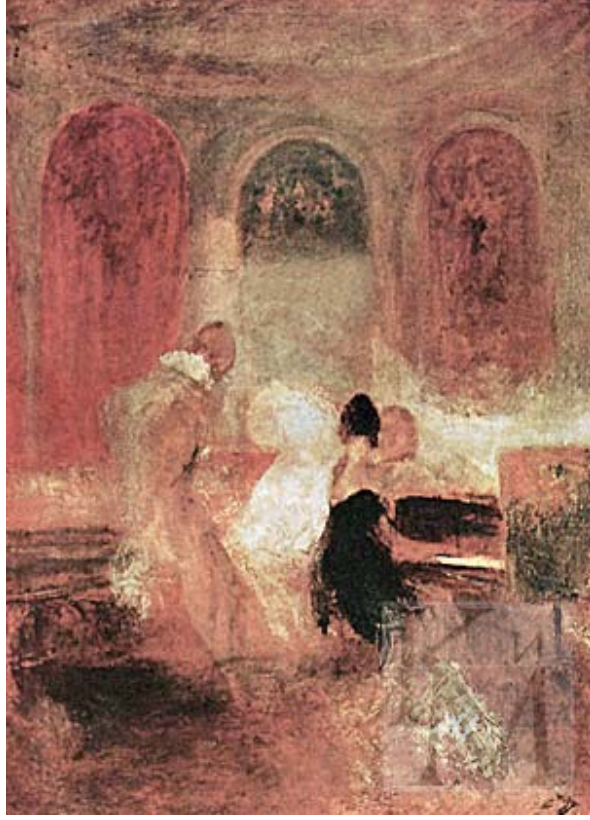
الشكل رقم (6) لوحة بعنوان: "حفلة موسيقية" للرسام جوزيف تيرنير ( 1775 - 1851 ) موجودة في Tate Gallery, England

تجلس في هذا الحيز الدائري ذي الأقواس سيده في ثوب قاتم وهي تعزف على آلة الكلافيسان، ويستمع إلى عزفها صديقتان لها. تبدو أشكال النساء والكلافيسان وخطوط الغرفة كما لو كانت جميعها مغطاة وغارقة في غيمة ذهبية، يخترق بعض من شعاع الشمس داخل الغرفة ويحوم بشكل دائري مماثل لحركة رقصة الفالس البطيئة. تبرز هذه الحركة الدائرية خطوط السقف. وهنا يبدو كما لو أنك تستمع إلى نغم تلك الرقصة.