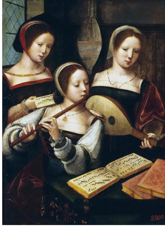
الشكل رقم (2) لوحة بعنوان: " موسيقيات " لرسام غير معروف من عصر القرن السادس عشر موجودة في The Hermitage Museum, St. Petersburg

تصور اللوحة ثلاث فتيات: اثنتان يعزفن على آلات موسيقية قديمة، بينما الثالثة تغني. وأمامهن أوراق لمدونات موسيقية ( النوتة) التي تعود لأغنية "سأعطيك الفرح"، الشعبية في ذلك الوقت للمؤلف الموسيقي كلودين دي سيرميزو Claudin de Sermisy (1562-1490) 4 . وكذلك الحال في لوحة للفنان الإيطالي الواقعي من عصر النهضة ميكائيل أنجلو كارافادجو Michelangelo da Caravaggio (1610-1573) " عازف العود"، يقوم بعزف مادريجال "أنت تعرف أنني أحبك" للمؤلف الموسيقي أركاديلت Jacques Arcadelt (1568 - 1507)، وذلك طبقاً للمدونة الموسيقية التي تظهر أمام العازف في اللوحة. لفترة طويلة كان هناك اعتقاد بأن النوتة في المدونة الموسيقية عبارة عن مجموعة مبعثرة من النوتات العشوائية، لكن الرسام أبدى عناية فائقة بكافة تفاصيل النوتة، ولم يسمح لنفسه بأن يتغاضى حتى عن كسر بسيط جداً في آلة العود 5 .