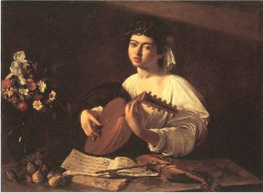
الشكل رقم (3) لوحة بعنوان: "عازف العود" للرسام ميكائيل أنجلو كارافاجو (1573-1610) موجوده في متحف المتروبوليتان في امريكا

منذ بداية الثلث الأول من القرن التاسع عشر، بدأ الرسامون الرومانسيون (Romantics) يفكرون جدياً بموسيقية فن الرسم، فسعوا أن تكون لوحاتهم مليئة بالموسيقى، وذلك عن طريق استخدامهم عمداً لتقنيات رسم خاصة. وبالتالي كان للموسيقى دور في تكوين اللوحة، إذ برزت (الموسيقى) في اللوحة على الرقعة من خلال انسجام الألوان، وضمن إيقاعات موسيقية، ومن خلال التفاوت في الضوء والظل والتلون، من هنا ظهر لدى الرومانسيين ما يسمى المشهد، واللوحة التاريخية، والبورتريه.